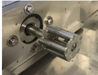
Capacidad de giro lento de la cesta