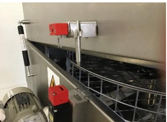
Mecanismo de cierre de seguridad