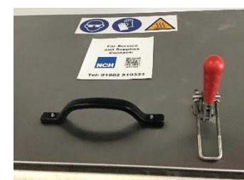
Asa de cierre aislada