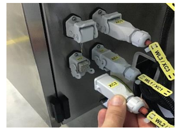
Cambio del componente de conexión rápida