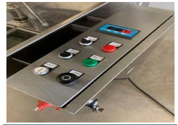
Panel de control con pantalla digital e instalación de precalentamiento