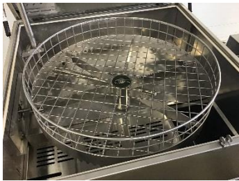
Perspectiva de tamaño de la cesta