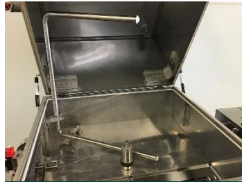
Barras de pulverización inferior, superior y lateral