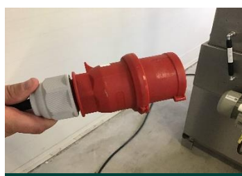
Enchufe trifásico neutro y a tierra de 415 V y 32 A